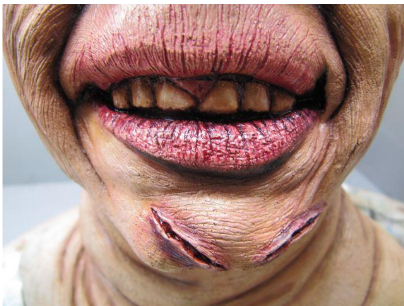
Détail de la bouche et des dents... Detail of mouth and teeth...