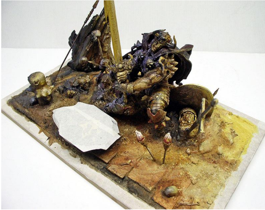
Autre vue... Other view...