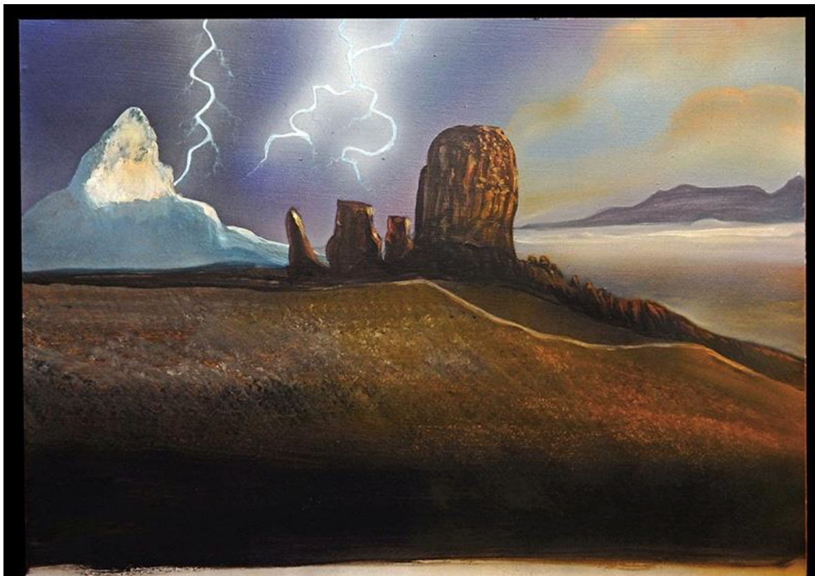
Un fond peint est ajouté pour "embellir" la scène...