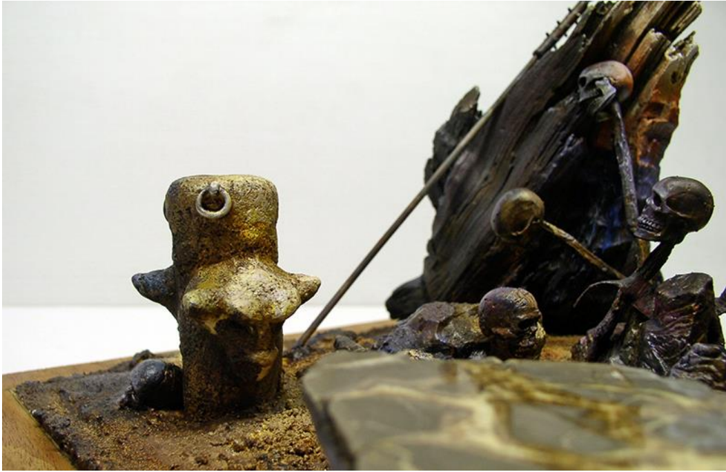
Eclat de lumière sur le poteau... Flash of light on the pole...