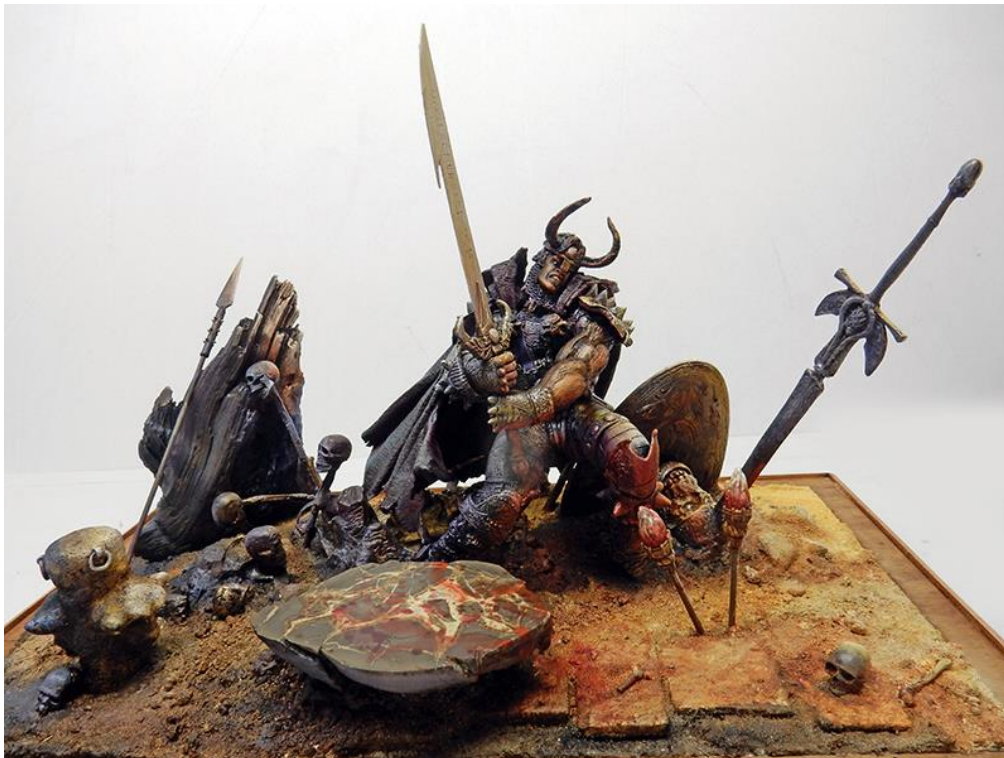
La peinture est terminée... The painting is finished...