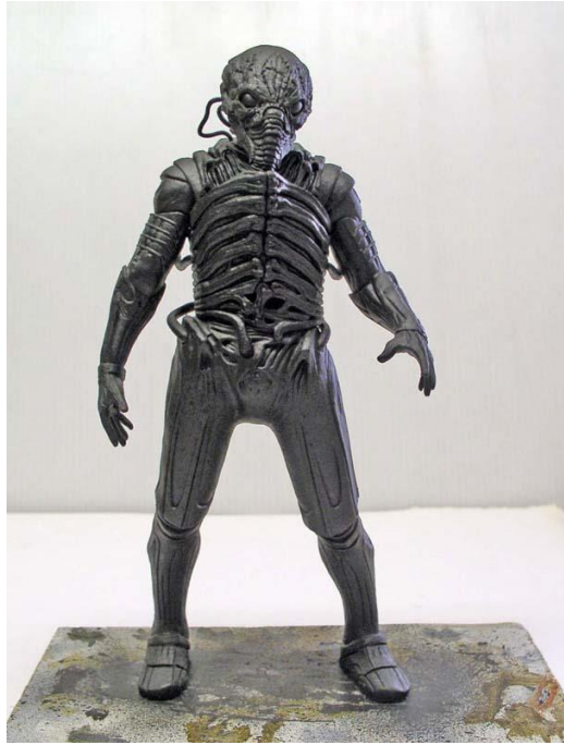
A droite, la figurine reçoit une couche de noir mat à l'aérographe... On the right, the figure is airbrushed with a coat of matte black...