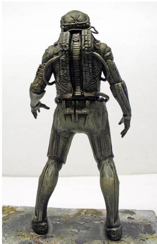
Peinture du Pilote : Humbrol 110 + 116 + blanc...