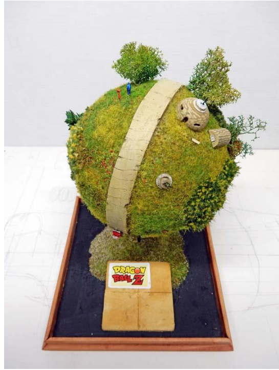
Pose des accessoires, les arbres ajoutés, le socle posé... Fitting the accessories, adding the trees, installing the base...