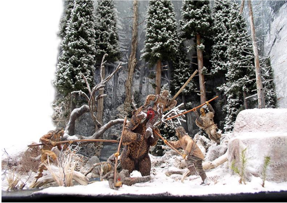
Scène de chasse à l'ours époque magdalénienne dans le nord de l'Europe – 10 000 ans...