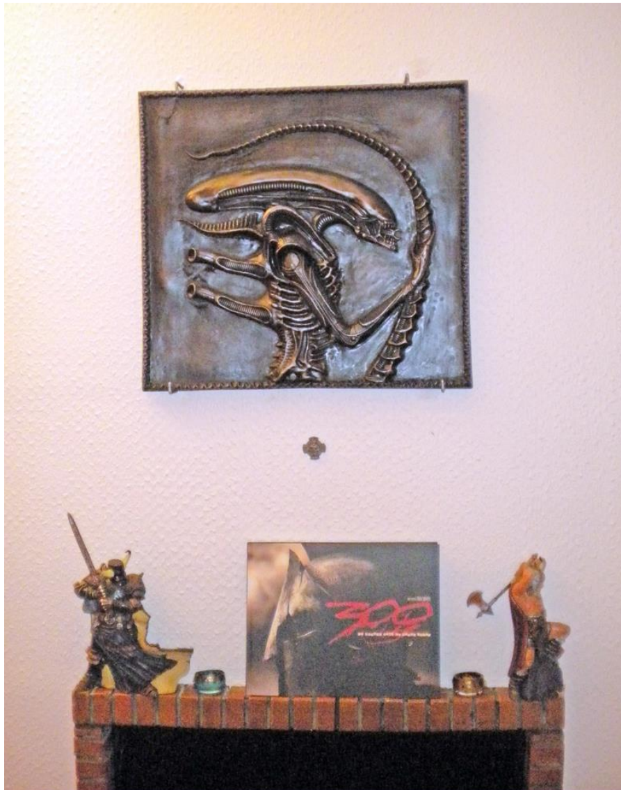
La plaque fixée au mur...